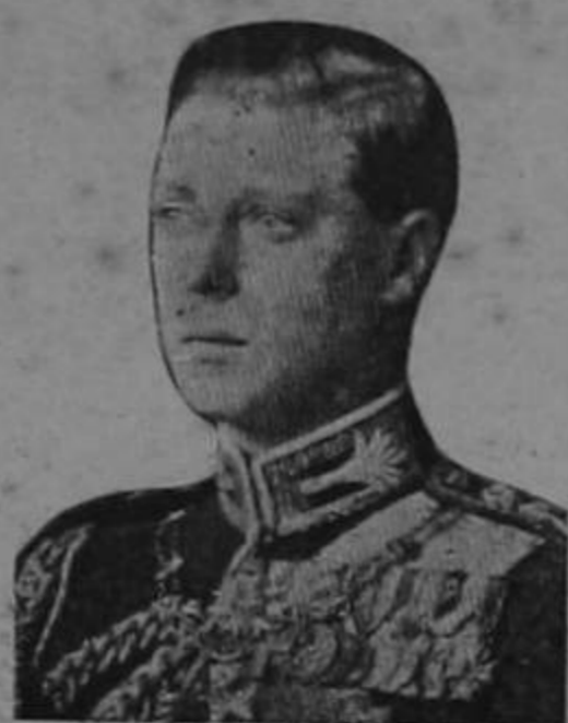
KING EDWARD VIII

The reported result of the conference which took place some couple of weeks ago between the King of England, his mother, the Duke of York and others, was either altogether misleading or King Edward has gone back on the assurance he is stated to have given that there would be no marriage with Mrs. Simpson, as the very latest advices from London indicate that he still persists in his intention to marry the lady, and that this threatens the most serious constitutional crisis possible.