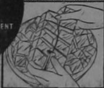
Plenty of ice cubes with Electrolux

RUNS ON KEROSENE (COAL OIL) WITHOUT MACHINERY NEEDS NO ELECTRIC CURRENT NO DAILY ATTENTION