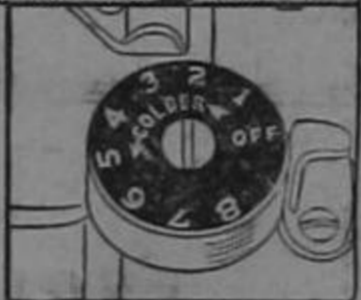
Temperature regulator speeds freezing