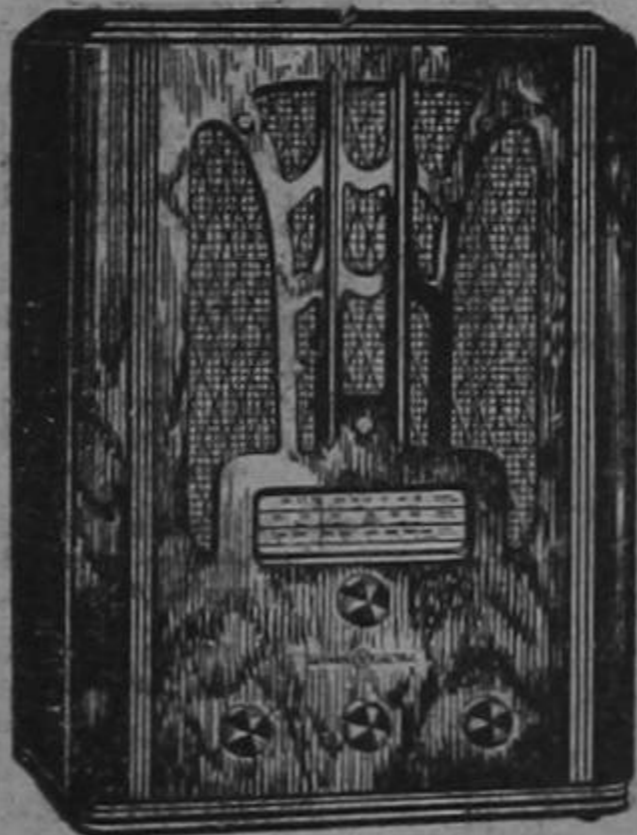
RADIO G. E. MODELO E-81

La rara belleza de sus muebles constituye la nota característica de la serie 1936-1937 de radios General Electric, debida al genio creador del propio estilista de al G. E., uno de los dibujantes industriales de más renombre en los Estados Unidos.